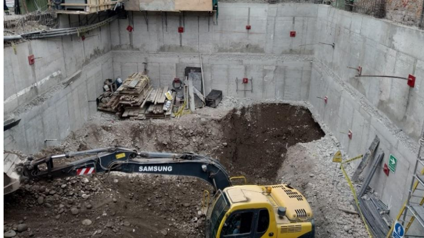
Perforación proyectada en el tercer anillo