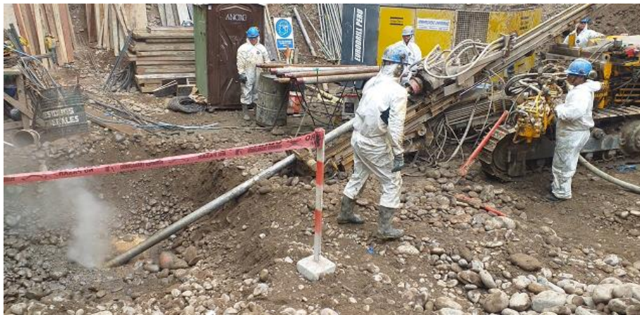
Extracción de la perforadora